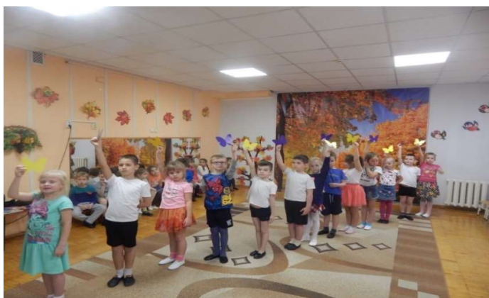
Рисунок 3. Культурно-досуговая программа, посвящённая Дню матери

Поводом для инициации педагогами нашего детского сада культурных практик являются события, происходящее в детском саду, существующая в дошкольном учреждении традиция. Например, «Новый год», «День матери», «День добрых дел», «День здоровья» и пр. Иницилируемые культурные практики предполагают насыщение детской жизни разнообразными культурными реалиями, открывают для дошкольников новые грани активности, новое содержание жизни. К таким видам культурных практик относятся тематические детские праздники, проведение ярмарок и спортивных состязаний, организация выставок детских работ и конкурсов эрудитов, проведение культурно-образовательных проектов и социальных акций и пр. (рис.3) Например: «Папа почитай», «Дари добро».