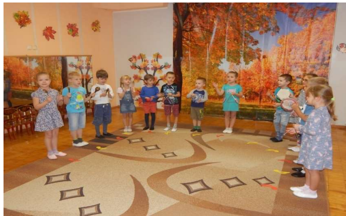
Рисунок 1. Игра «Прогулка» - средний дошкольный возраст

В чем мы видим специфику культурных практик дошкольника в музыкальной деятельности? Эмоционально окрашивая игровые действия, используя средства музыкальной выразительности, многообразие музыкальных интонаций, ритмических рисунков мелодии, предъявляя детям требования проявлять волевые усилия, сосредотачиваясь на игровом действии, у ребёнка формируется понимание музыкально-игрового задания, вызывает быстроту реакции, формирование музыкальных и двигательных навыков, активизацию чувств, воображения, мышления, умения взаимодействовать друг с другом. Участвуя в музыкальной игре, ребенок не только развивает музыкальные способности (слух, ритм, пластику движений), но и вступает в творческий диалог с взрослым и со сверстниками, знакомится с окружающим миром, учится выражать эмоции, адаптируется к социуму (рис.1).