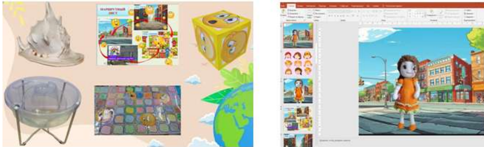
Рисунок 7. Демонстрационный материал

Демонстрационный материал: морская раковина, ковер-самолет, центр воды для проведения эксперимента, маршрутный лист, куб с пиктограммами эмоций, презентация PowerPoint - анимированный видео ролик с куклами помощницами - Улыбашка, Грустинка и Удивлялка. (Рис.7)