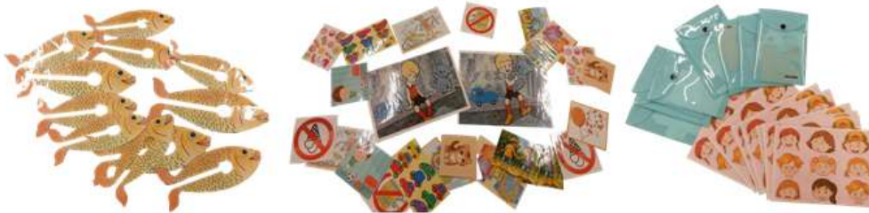
Рисунок 8. Раздаточный материал для групповой и индивидуальной работы

Раздаточный материал: для групповой и индивидуальной работы - конверты с заданиями, рыбки из бумаги, пипетки. (Рис.8)