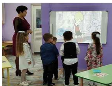
Рисунок 13. Грустинка просит ребят помочь Малышу из повести «Малыш и Карлсон»