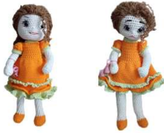
Рисунок 6. Анимирование кукол с помощью русскоязычной нейросети Гига Чат от Сбера

На занятии был использован следующий материал.