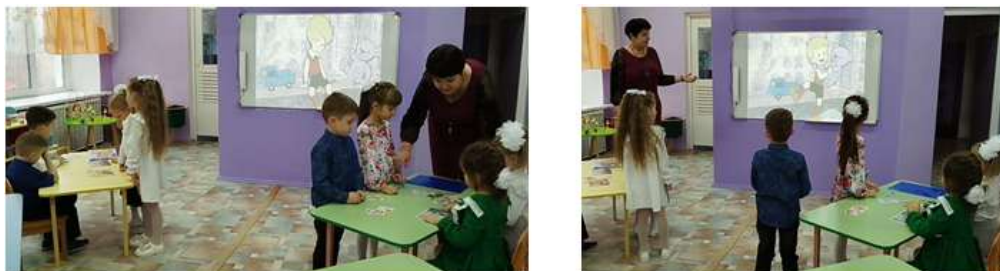
Рисунок 14. Работа в группах. Дети выбирали карточки с предметами, которые помогут развеселить малыша

Работая в группах, дети выбирали на карточках разные предметы, с помощью которых можно было бы развеселить малыша. Ребята сделали вывод, что даже самое грустное настроение можно превратить в радость. (Рис.14)