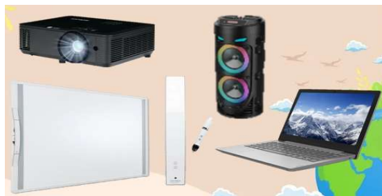
Рисунок 9. Цифровое оборудование

Занятие «Путешествие по городам эмоций» представляет собой увлекательное путешествие по воображаемым городам, каждый из которых символизировал определённую эмоцию.