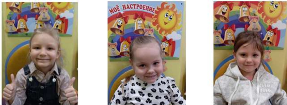
Рисунок 4. Индивидуальные беседы о настроении детей

Индивидуальные беседы о настроении и причинах его изменения. (Рис.4)