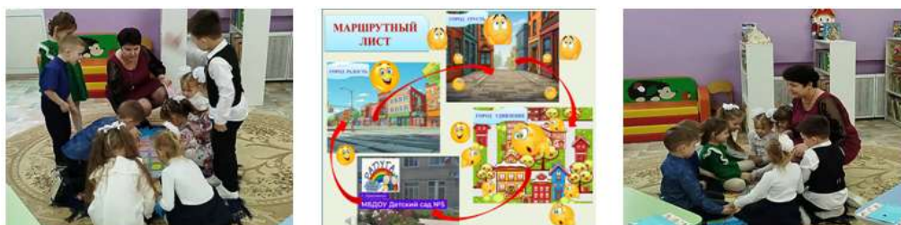
Рисунок 1. Дети, имея маршрутный лист, отправились в путешествие на ковре – самолете

Занятие «Путешествие по городам эмоций» для детей старшего дошкольного возраста было направлено на создание условий для формирования и активизации эмоционально - речевой сферы через игровые, речевые, творческие и социально-коммуникативные формы деятельности, систематизацию знаний о базовых эмоциях. Работа воспитателя заключалась в обучении детей распознавать собственные эмоции и чувства окружающих, выражать свои переживания и понимать настроение других людей. Во время игры ребята, имея маршрутный лист, совершили путешествие на ковре – самолете, погружаясь в атмосферу эмоций и проходя различные испытания. (Рис.1)