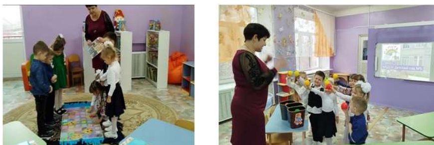
Рисунок 17. Возвращение на волшебном ковре-самолёте в детский сад Выбор шаров детьми для выражения своего настроения после путешествия

Дети учились достигать поставленной цели, стремились к развитию и самосовершенствованию, независимо от внешних факторов. На волшебном ковре-самолёте мы вернулись в детский сад и с помощью красочных шаров дети показали своё настроение после путешествия. Желтый шар – если на занятии понравилось всё, красный шар – если понравилось выполнение какого-то одного задания, зеленый шар – если на занятии не понравилось ничего. (Рис.17)