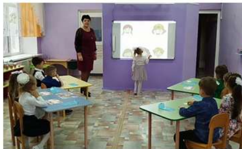
Рисунок 12. Работа у интерактивной доски и с индивидуальными карточками

Кукла Улыбашка поблагодарила ребят за работу, и с помощью маршрутного листа мы отправились путешествовать дальше.