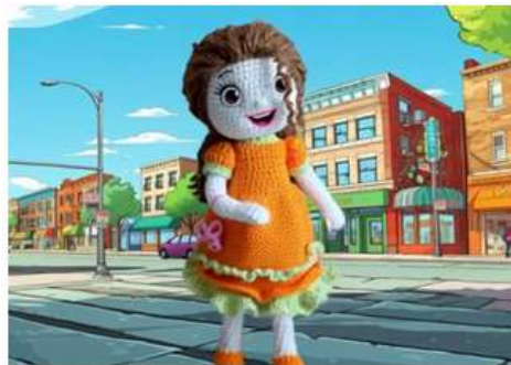
Рисунок 11. Встреча с анимированной куклой Улыбашкой в городе Радости

Улыбашка предложила детям поиграть в интерактивную Мимео игру «Удали лишнюю эмоцию». На экране должны были остаться только эмоцию радости. Выполняя задание, как на доске, так и за столом, с помощью индивидуальных карточек дети учились различать эмоции, что помогло им лучше справляться с ситуацией, осознавали собственные эмоции, сильные стороны и слабые, понимая влияние эмоций на решения. (Рис.12)