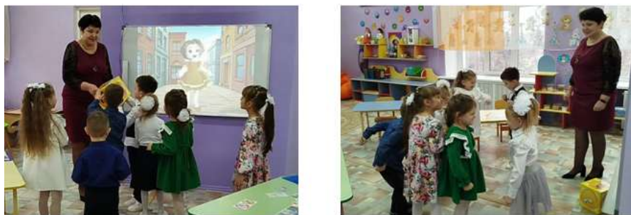
Рисунок 15. Игра с волшебным кубиком эмоций

Кукла Грустинка поблагодарила ребят за помощь и подарила волшебный кубик, с которым мы поиграли в игру «Раз, два, три, настроение, замри!». (Рис.15)