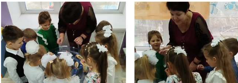
Рисунок 16. Экспериментированием с водой и рыбками от Удивлялки

Дети учились достигать поставленной цели, стремились к развитию и самосовершенствованию, независимо от внешних факторов. На волшебном ковре-самолёте мы вернулись в детский сад и с помощью красочных шаров дети показали своё настроение после путешествия. Желтый шар – если на занятии понравилось всё, красный шар – если понравилось выполнение какого-то одного задания, зеленый шар – если на занятии не понравилось ничего. (Рис.17)