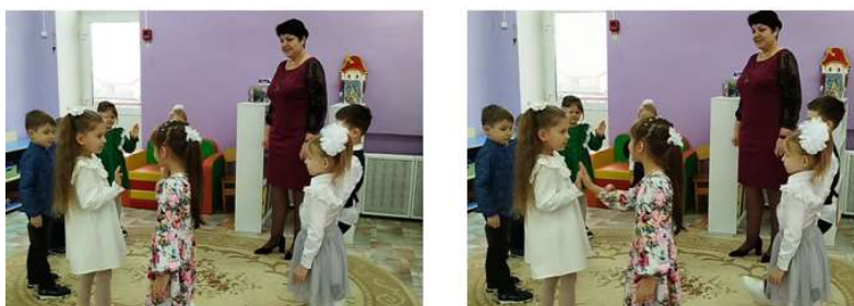
Рисунок 10. Приветствие друг друга при помощи прикосновения ладошками со словами «Я рад тебя видеть...»