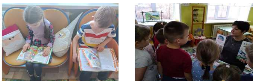
Рисунок 2. Рассматривание иллюстраций, фотографий с разнообразными эмоциями и ситуациями

При подготовке к занятию с детьми рассматривали иллюстрации, картинки, фотографии с разнообразными эмоциями и ситуациями, связанные с выражением различных чувств. (Рис.2)