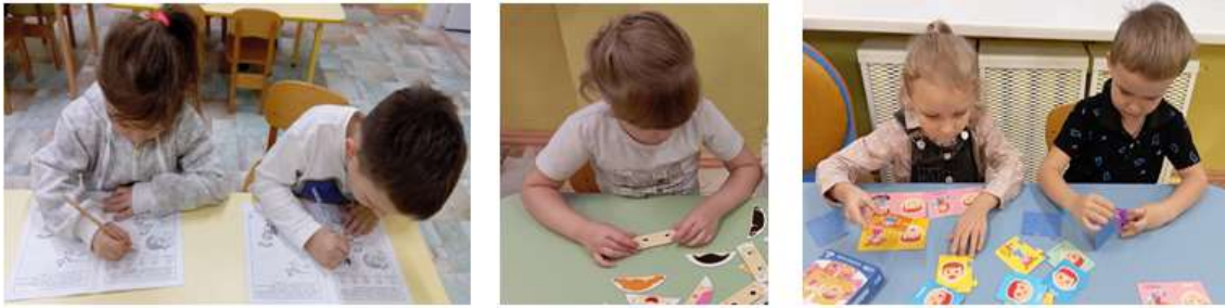
Рисунок 3. Работа с дидактическим материалом

Индивидуальные беседы о настроении и причинах его изменения. (Рис.4)